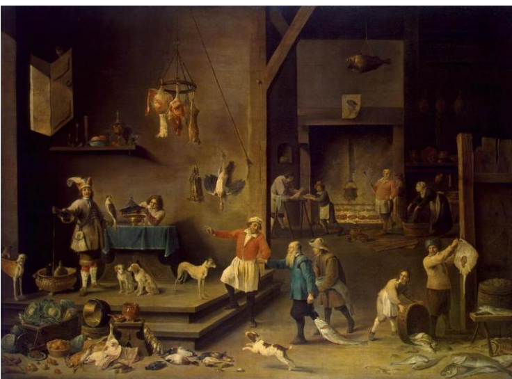
David Tenier nuoremman maaluksessa (The Kitchen 1646) eläimet ovat mukana keittiössä