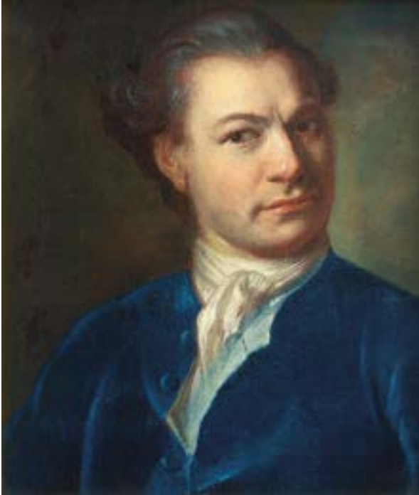
Johan Henrik Scheffels målning från slutet av 1750-talet är sannolikt det tidigaste porträttet av greve Gustav Philip Creutz, då mellan 25 och 30 år gammal. Det tillhörde Tankebyggarordens praeses Hedvig Charlotta Nordenflycht, som hade en rad porträtt av sällskapets ledamöter.

intellektuella förebilder och lärda kontakter under studietiden i Åbo och fäster särskild uppmärksamhet vid den betydelse de hade för hans filosofiska mognad. Samtidigt kan jag uppskatta den rationalistiska och samhällskritiska filosofins tillstånd i Åbo och Finland i slutet av 1740-talet och påvisa de naturvetenskapliga professorernas och deras lärors betydelse för kommande generationer av svenska ämbetsmän. Den idé- och nätverkshistoriska fallstudien gör det även möjligt att lyfta fram den generation av universitetslärare som föregick Porthan och påvisa deras roll i formandet av rikselitens världsbilder.