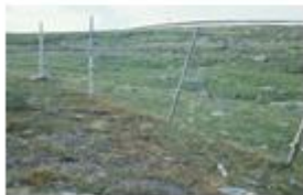
Renstängslet. Vänster: höstbete; höger: sommarbete