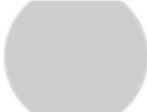
Lukivaikeus voi näkyä monin ta...