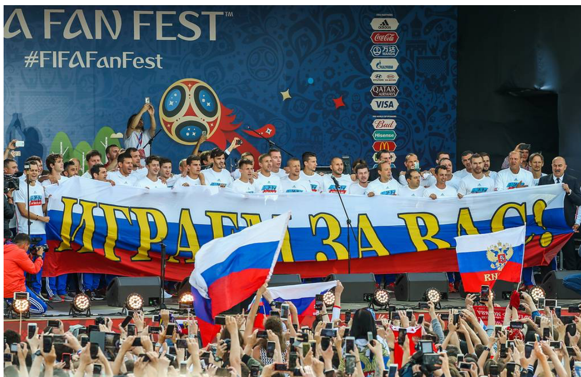
Kuva 5. Venäläiset fanit kiittämässä maajoukkuetta.

Kuvassa 5 venäläiset fanit ovat kerääntyneet tapahtumaan kiittämään maajoukkuettaan sijoituksesta kisoissa. Joukkue seisoo lavalla pidellen Venäjän lippua, jossa lukee ”Pelassimme teidän puolestanne”. Katsomo on täynnä faneja ja useampia Venäjän lippuja.