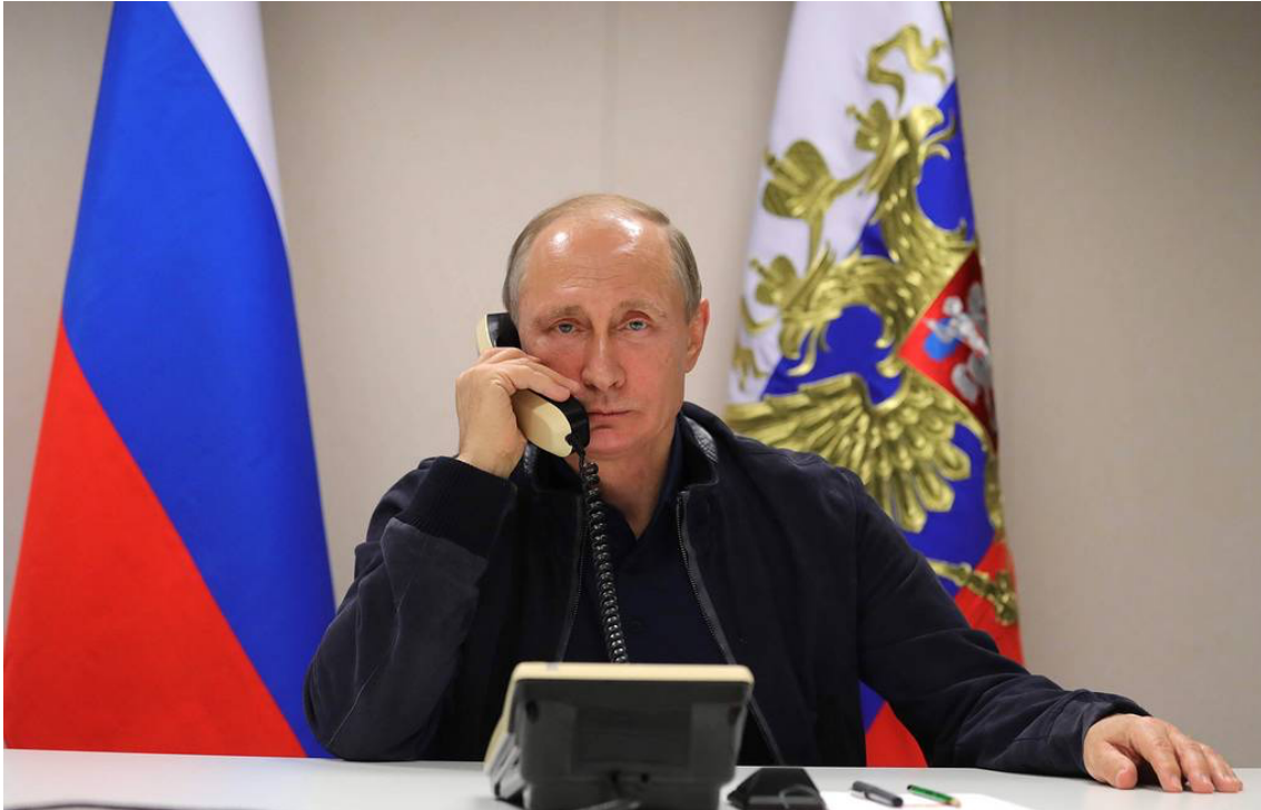
Kuva 8. Putin onnittelee Ranskan presidentti Macronia finaaliapaikasta..

Kuva 8 on erikoinen MM-kisoista julkaistujen mediakuvien kontekstissa, koska se ei liity suorasti urheiluun ja on avoimesti todella poliittinen. Putin on jälleen asetettu kuvan keskelle ja tarkennus on hänessä. Ympäristö on hyvin yksinkertainen: taustalla näkyvät vain kaksi Venäjän lippua. Koska kuvassa on vähän elementtejä, ohjaa se katsojan huomion vain presidenttiin ja lippuihin. Kuvat MM-kisoista ovat yleensä iloisia ja korostavat ihmisten yhteisöllisyyttä, mutta kuvan 8 tunnelma on kuitenkin täysin erilainen. Putin on esitetty virallisessa työympäristössään yksin. Hänellä on totinen ilme kasvoillaan ja katse suoraan kameraan, jolla voidaan viestiä itsevarmuutta. Presidentti puhuu puhelimessa, joka voi sekin symboloida useaa asiaa. Puhelulla voidaan viitata esimerkiksi rauhanomaisiin ja diplomaattisiin suhteisiin. Tasavertainen toimijuus ja neuvotteluyhteydet länsimaihin ovat sekä maabrändäyksen että pehmeän vallankäytön harjoittamisen kannalta oleellisia (Dinnie 2022, 109; Nye 2004, 8–9). Työympäristöllä ja puhelulla voidaan myös pyrkiä vahvistamaan mielikuvaa Putinista pätevänä ja menestyvänä johtajana. Putinin brändiin kuuluu hänen työmoraalinsa esittäminen jopa yli-inhimillisenä: MM-kisojenkin aikana presidentti hoitaa työtehtäviään. Näin luodaan mielikuvaa Putinista, joka työskentelee väsymättä Venäjän kansalaisten hyvinvoinnin puolesta (Beale 2018, 132–135).