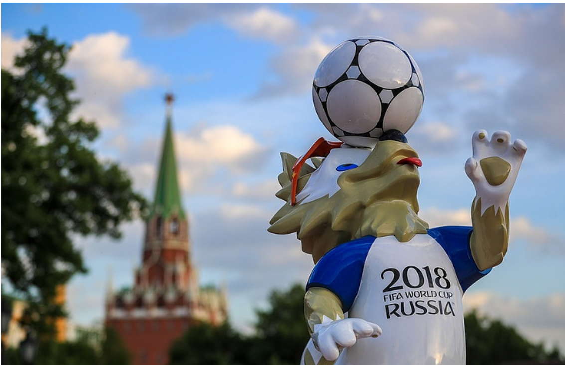
Kuva 2. Kisojen maskotti Zabivaka-susi ja Spasskajan torni. (Bobylev/TASS 2018).

Kuvassa 2 on jälleen etualalla kisojen maskotti Zabivaka, joka taiteilee jalkapallolla. Taustalla näkyy Kremlin torneista tunnetuin Spasskaja. Kuvan asettelu sekä tausta ovat tietoinen valinta: Kremlin torni ei liity varsinaisesti jalkapalloon mitenkään, vaan tarkoituksena on esitellä Venäjän kulttuuria ja arkkitehtuuria.