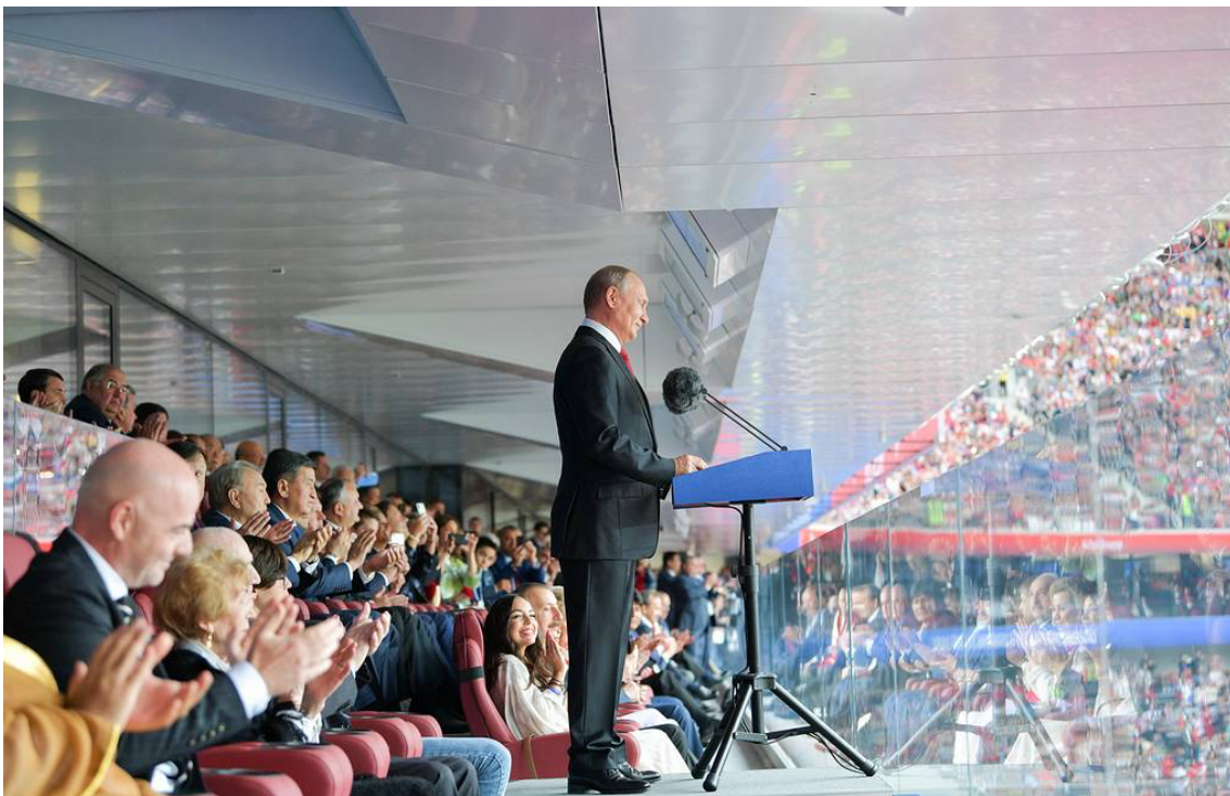
Kuva 6. Putinin puhe kisojen avajaisseremoniassa. (Druzhinin/TASS 2018).

Ensimmäisessä tarkasteltavassa kuvassa presidentistä (kuva 6) Putin seisoo korokkeella pitämässä puheita MM-kisojen avajaisseremoniassa.