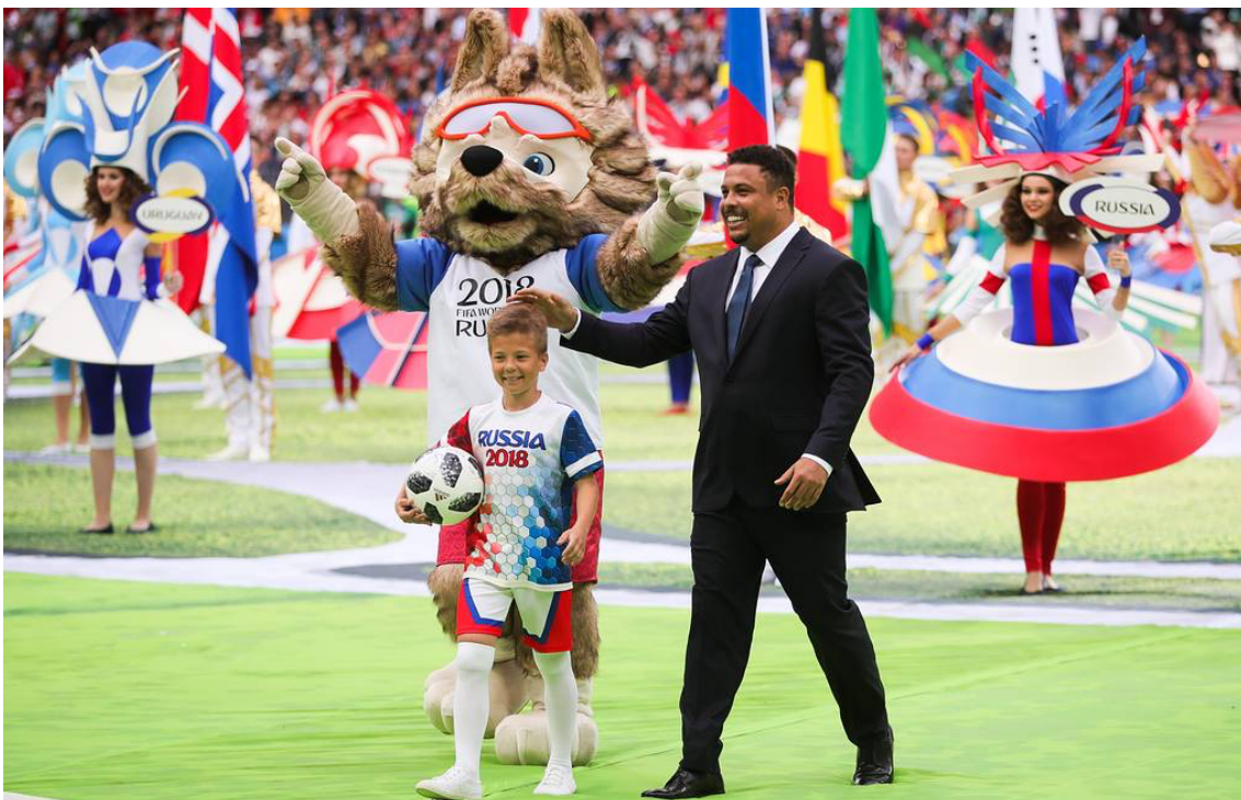
Kuva 1. Brasilialainen jalkapalloilija Ronaldo Venäjän MM-kisojen avajaisseremoniassa.

Kuva 1 on Venäjän MM-kisojen avajaisseremoniasta. Kuvassa etualalla ovat kisojen maskotti Zabivaka, Brasilian entinen huippupelaaja Ronaldo sekä venäläinen poika. Taustalla olevat tanssijat esittävät osallistuvia maita, mutta tarkennus osuu vain Venäjää kuvaavaan tanssiijaan. Kuvan tunnelma on iloinen ja värit kirkkaat.