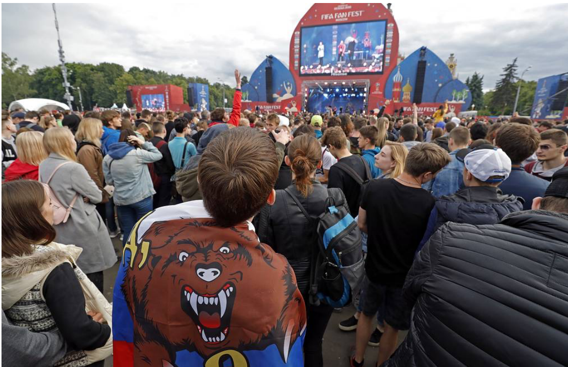
Kuva 4. FIFA Fan Fest -fanitapahtuma Moskovan valtionyliopiston edessä. (Japaridze/TASS 2018).

Kuvassa 4 väkijoukko on kerääntynyt FIFA Fan Fest -fanitapahtumaan seuraamaan avajaisseremoniaa ja kisalähetystä. Tapahtuman lava ja näyttö on rakennettu muistuttamaan Pyhän Vasilin katedraalia.