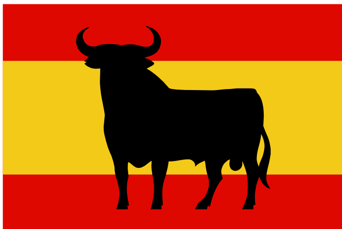
Kuva 2 Toro de Osborne -härkäsiluetti lisättyä Espanjan lipun päälle.

Näkyvimmin härkäsiluettiin yhdistetyt nationalistiset arvot näkyvät muokatussa Espanjan lipussa, jonka päälle lisätty Toro de Osborne -kuva (kuva 2).