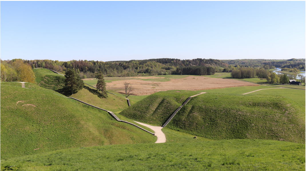
Kuva 1. Kerna-vèn linnavuoret avautuvat alueen näköalatasanteella ainutlaatuisella tavalla.

tikauden ulkopuolella erityisen aktiivista julkista liikennettä. Noin 50 kilometrin matka oli kuitenkin ohi nopeasti ja ensim- mäisellä ajokerralla tulini ajaneeksi Kerna- vèn kylän poikki ennen kuin edes ymmär- sin kylänraitin todella alkaneen. Viehättävä maalaiskylä onkin parasta kokea jalan, ja löydettyäni majoituspaikkani suuntasin- kin välittömästi kävellen kohti arkeologista puistoa. Astuessani alueen porteista katselu- tasanteelle matkaväsämykseni katosi kerta- heitolla, sillä linnavuorten hallitsema laakso näytti ilta-auringon valaisemana taianomai-