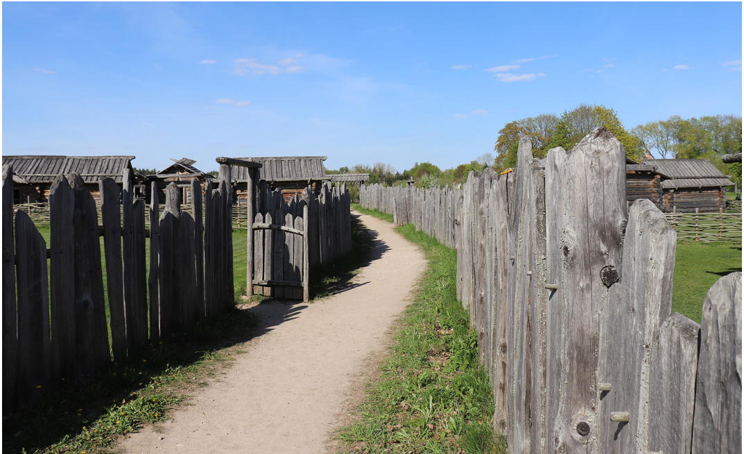
Kuva 2. Arkeologisen puiston ulkoilmamuseossa pääsee kulkemaan keskiaikaisiin pihapiireihin, joita erottavat puupaaluista valmistetut tai pajunversoista punotut aidat.

mamuseota hyödynnetään aktiivisesti ope- tuksessa ja museolla onkin tapana järjestää siellä koululaisille historian elävöitykseen perustuvia työpajoja, joiden aikana nuoret eläytyvät saamiinsa rooleihin liikkuessaan ulkoilmamuseon rakennuksissa ja näiden pihapiireissä.