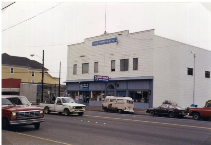
Kuva 8. Suomi-Haali, Astoria, Oregon. Heinäkuu 1994.