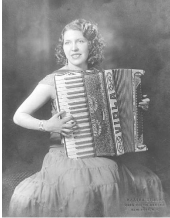
Kuva 1. Viola Turpeinen soittaa harmonikkaa, johon on kirjattu Viola. Kuva on otettu Studio Kaatrassa, New Yorkissa, Yhdysvalloissa. Siirtolaisuusinstituutti.

tavoin. 49 Esimerkiksi siis tässä tapauksessa kyseisten eri julkaisujen Turpeisesta otetusta kuvasta voi ajatella olevan eri kuvia teoreettisesta näkökulmasta, mutta käytännössä ne ovat ainakin saman arkistoidun kuvan eri ilmentymiä. Oleellinen ero esimerkiksi verkossa julkaistujen ja Siirtolaisuusinstituutin omissa digitoiduissa aineistoissa olevan kuvan välillä on tällä kertaa ero niille ilmoitetussa vuosiluvussa.