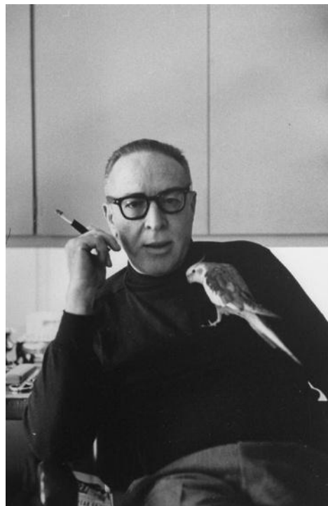
Kuva 1. Dalton Trumbo vuonna 1957.

Vapautumisensa jälkeen Trumbo perheineen muutti joksikin aikaa Meksikoon. Palattuaan Kaliforniaan Trumbolla oli töitä, mutta hän joutui kirjoittamaan käsikirjoituksia salanimillä. Hän