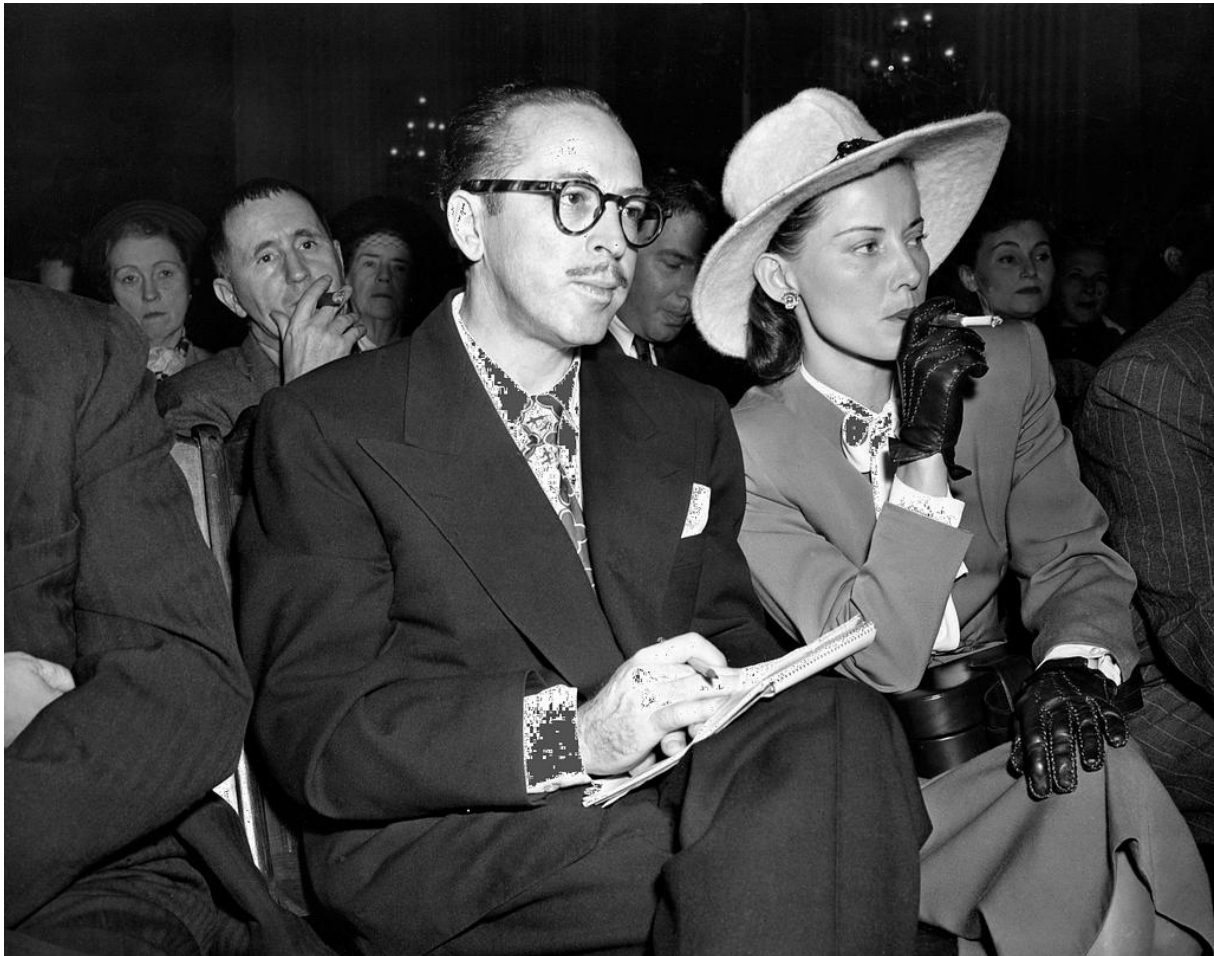
Dalton ja Cleo Trumbo HUAC:in kuulemisessa vuonna 1947.