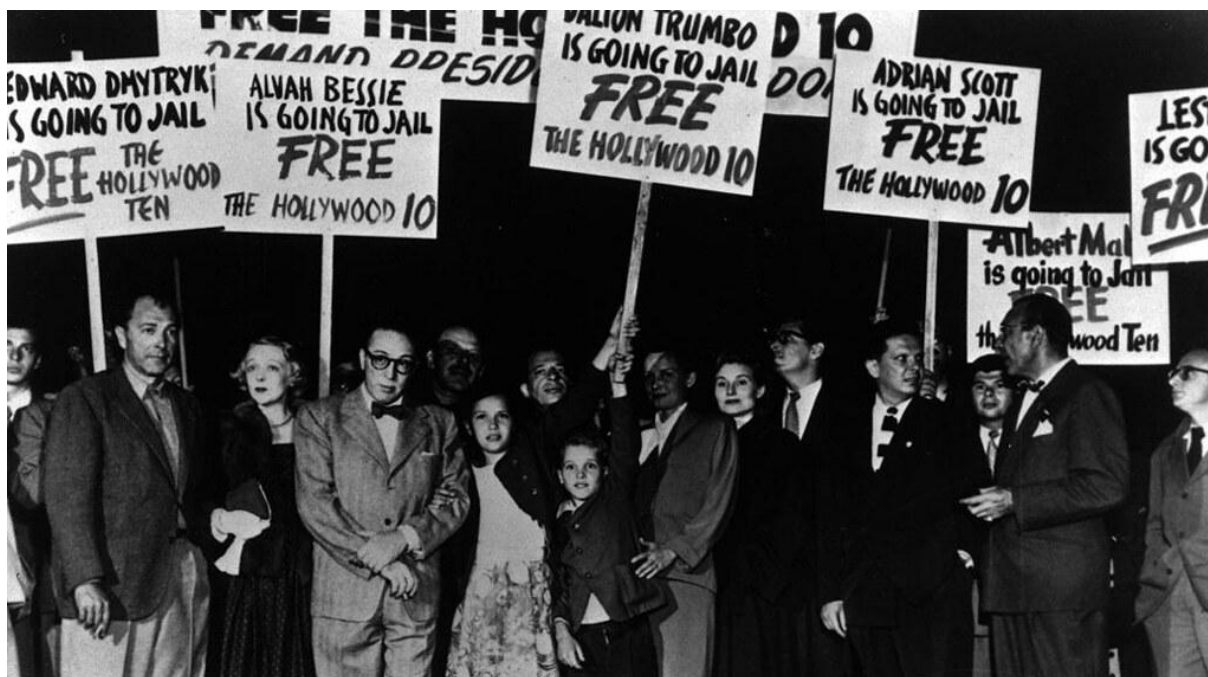
Hollywoodin kymmenikön mielenosoitus vuonna 1949.