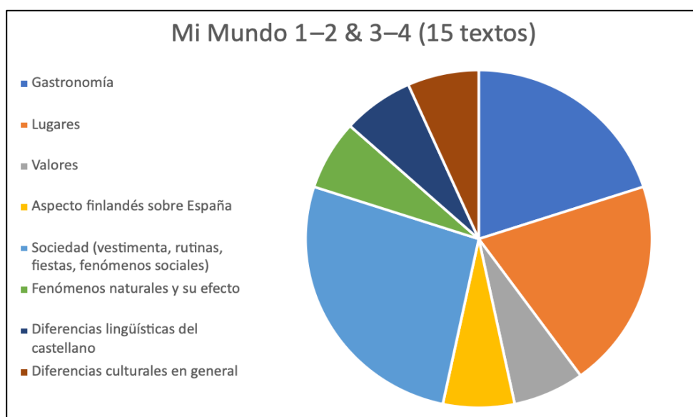
Imagen 1. Gráfico circular de las lecturas y sus contenidos en los manuales Mi Mundo 1–2 y Mi Mundo 3–4