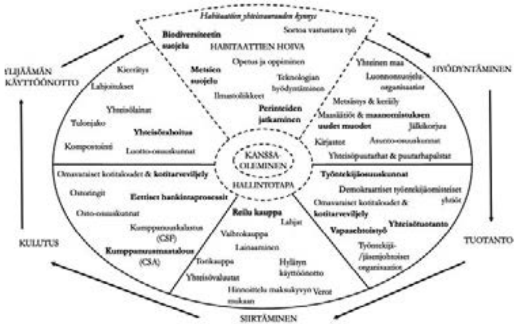
Kuvio 1: Toimeentulon kokonaisuus 28

miseksi (trans-commoning, suomennos kirjoittajan). 27 Kokonaisuuden osat voivat olla kontekstista riippuen mahdollisia tai todellisia (kuvio 1).