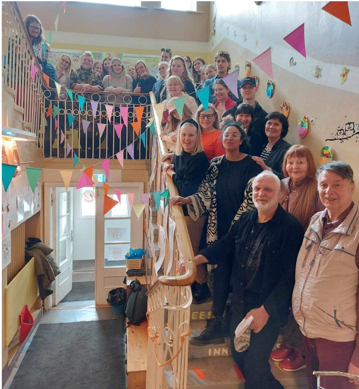
Vierailu Endlan lastentarhassa keväällä 2024.

Varhaiskasvatuksen integraatioprojektin opiskelijoiden näytelmät, joita esitetään päiväkodin lapsille, ovat hyvä esimerkki draaman ja pedagogiikan vuoropuhelusta. Vuoden mittaisen integraatioprojektin aikana varhaiskasvatuksen opettajaopiskelijat suunnittelevat ja toteuttavat laaja-alaisen projektin, joka integroi sekä taideaineet että varhaiskasvatuksen pedagogiikan. Yhteistyön myötä virolaiset ymmärsivät, että kyseessä oli myös mielekäs esimerkki pedagogisesta projektityöskentelystä, joka onkin opintojakson yksi pedagogisista periaatteista. Viime vuosina opiskelijat ovat esittäneet näytelmänsä viroksi. Näin opiskelijat ovat saaneet vahvistettua vuorovaikutusta ja lasten osallisuutta näytelmän lomassa.