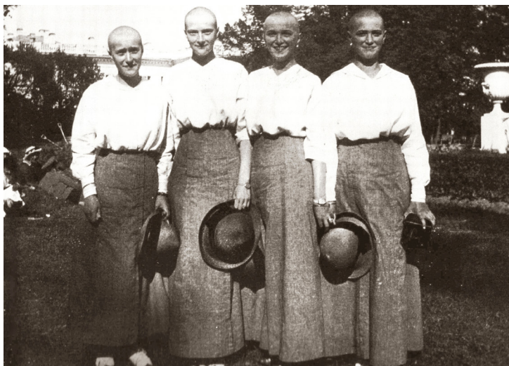
Keisariperheen tyttäret vuonna 1917.

Tehdessäni tätä tutkimusta naisten kaljuudesta ja siihen suhtautumisesta palasin tämän lukumuiston pariin. Löysinkin netistä valokuvan näistä nuorista suurruhtinattarista hiuksettomine päineen, josta romaanissa kerrotaan. Nuoret naiset hymyilevät ja esiintyvät pystypäin. Ehkä esiintyminen niin epänormaalisissa kampauksessa huvittaa heitä. Kuvan ei varmasti ollut tarkoitus vuotaa julkisuuteen, vaan jäädä yksityiseksi välähdykseksi nuorten huumorintajusta tai ilkkurisuudesta. Silti tämä yli sata vuotta sitten otettu valokuva kertoo mielestäni jotain tärkeää naisten kaljuudesta ja siihen suhtautumisesta.