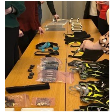
Luenolla opiskelijat pääsivät myös itse tutustumaan sykevälivaihtelun mittaamiseen kehitettyihin tuotteisiin.