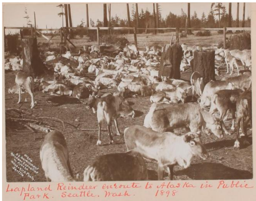
Liite 3: Wilse ja Kirk: Lapland Reindeer en route to Alaska in public park. Seattle, Wash. 1898. Valokuva. RG 239, laatikko 16, kansio 66, kuva nro 2051. Presbyterian Historical Society, Philadelphia, Pennsylvania.