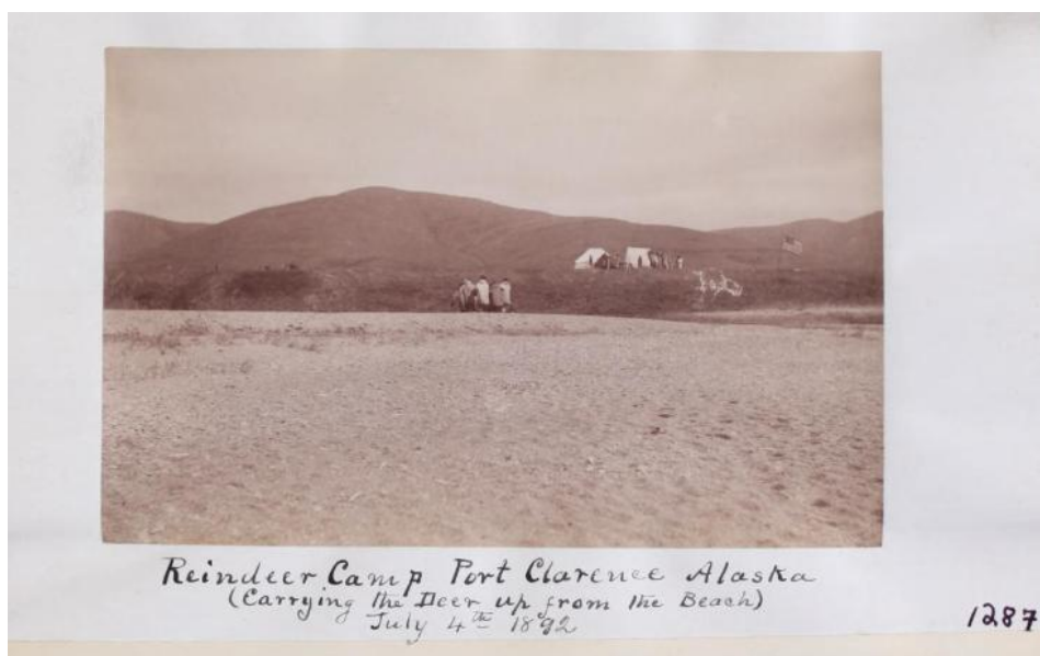
Liite 2: Reindeer camp, Port Clarence, Alaska (Carrying the Deer up from the Beach). 4.7.1892. Valokuva. RG 239, laatikko 15, kansio 29, kuva nro. 1287.