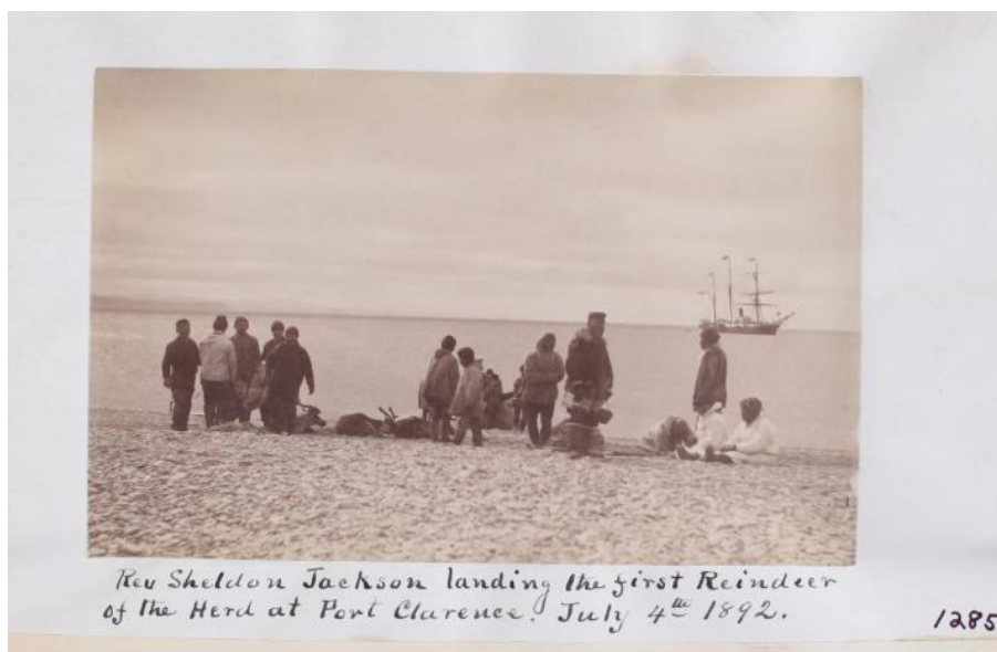
Liite 1: Rev. Sheldon Jackson landing the first Reindeer of the Herd at Port Clarence. 4.7.1892. Valokuva. RG 239, laatikko 15, kansio 29, kuva nro. 1285.