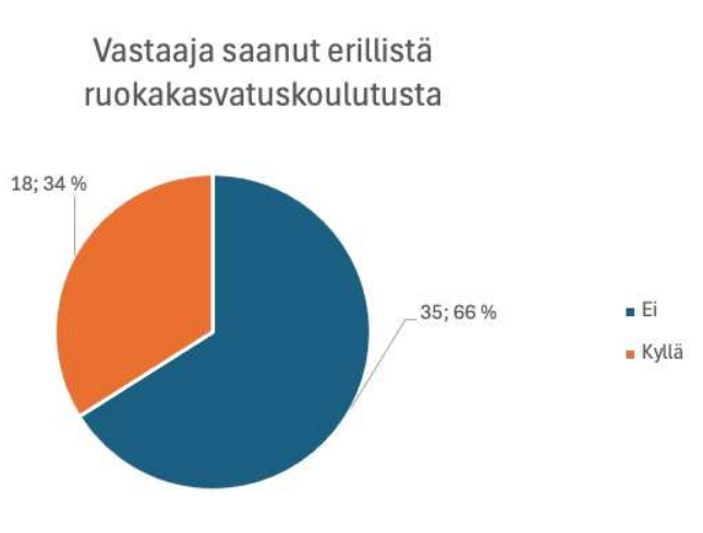
Kuvio 3. Erillistä ruokakasvatuskoulutusta saaneiden osuus ( n = 53 ).

Vastaajista suurin osa ( n = 35 , 66 %), ei ollut saanut erillistä ruokakasvatuskoulutusta (Kuvio 3.). Tulos on huomionarvoinen, sillä Hyvinkään VASU (2022) edellyttää henkilöstöltä aktiivista ja tavoitteellista ruokakasvatusta osana laaja-alaista osaamista sekä kestävän elämäntavan periaatteiden toteuttamista arjessa (Hyvinkään kaupunki, 2022).