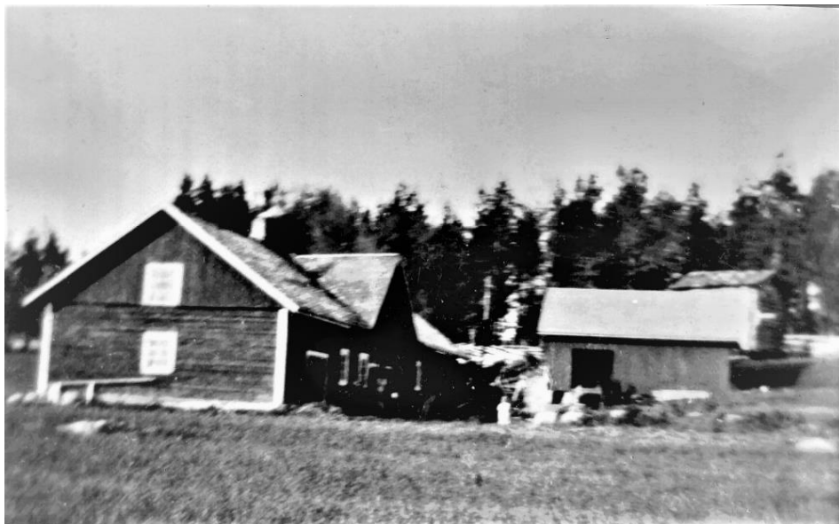
Kuva 3. Yli-Jussilan navetta ja piharakennuksia. Kuva Toivo Ojanen n. 1930.

havaittavissa hänen muistelmissaan, erityisesti kirjassa ”Yli-Jussilan vaiheita”. Tutkijana hän on ottanut retrospektiivisesti tarkoin selville mitä maanviljelyksessä tapahtui, millaisia suuntauksia noudatettiin, miten maanviljelys ja tilanhoito uudistuivat ja miten se näkyi kotitilalla.