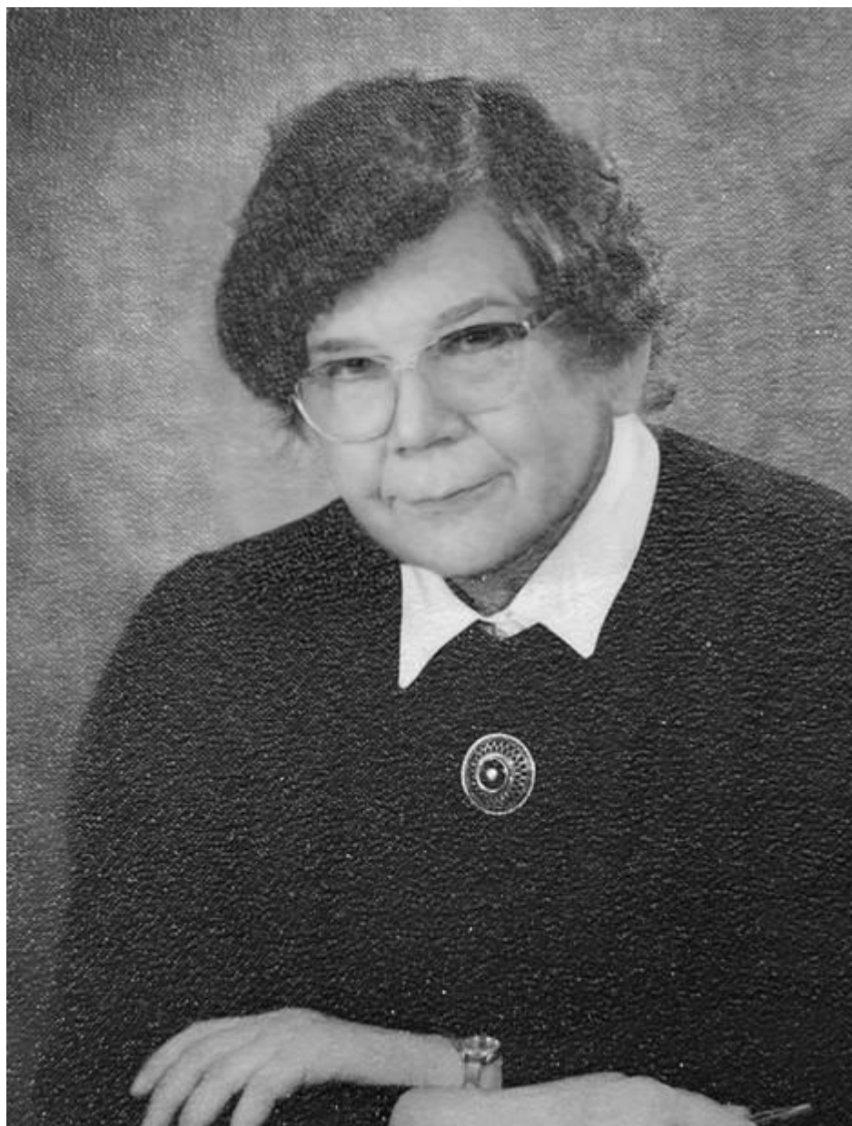
Kuva 10. Muistoissamme teologian tohtori, professori Eeva Ojanen (1927–2022).