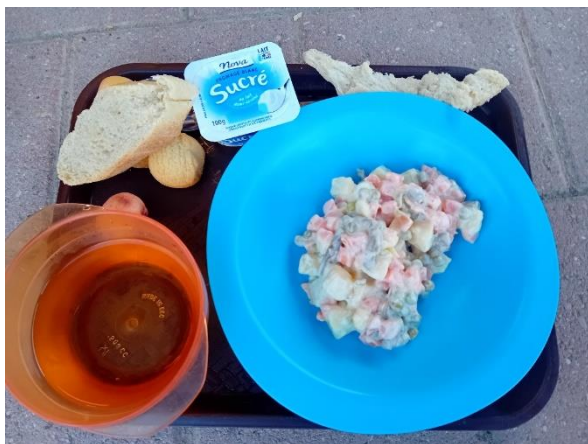
Kuva 1: Ateria Taizéssa

Ruokailu Taizéssa tapahtuu siten, että ruoka tarjoillaan ulkona. Ennen ruokailuhetkiä linjastoille muodostuu ainakin ruuhkaiseen kesäaikaan kymmenien metrien mittainen ruokajono. Kun jonotus on ohi, ruoka saadaan muoviasiastioihin ja syödään penkeillä tai maassa istuen ilman pöytiä. Ruoka on kokemukseni perusteella hyvin yksinkertaista (Ks. kuva 1). Aamupalalla tarjoillaan ranskalaiseen tapaan patonkia ja suklaata tai hilloa. Lounaalla ja päivällisellä on jotakin yksinkertaista ruokaa, tyypillisesti pavuista. Ruoan kanssa tarjoillaan ranskalaiseen tapaan usein myös juustoa ja patonkia. Ruoka on pääosin kasvisruokaa, mutta joinakin päivinä voidaan tarjoilla hieman myös lihaa. Kokemukseni perusteella ruokaa on ainakin ruuhkaisina kesäkuukausina melko vähän yhtä ihmistä kohden.