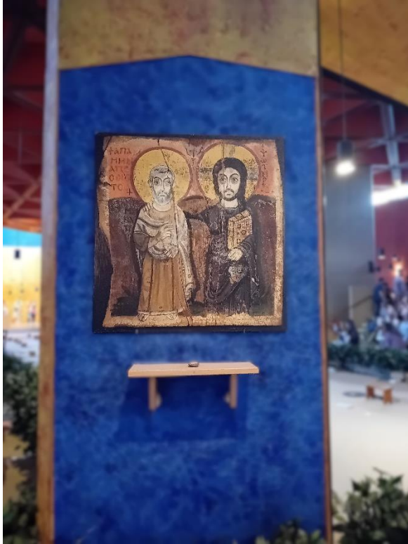
Kuva 6: Ystävyiden ikoni Taizéssa.

Tätä tutkimusta kirjoittaessani mieleeni tuli Taizén Sovituksen kirkossa esillä oleva ystävyiden ikoni (kuva 6), joka kertoo myös omaa tarinaansa luostariyhteisön pyrkimyksestä solidaarisuuteen, ystävyteen ja rauhaan.