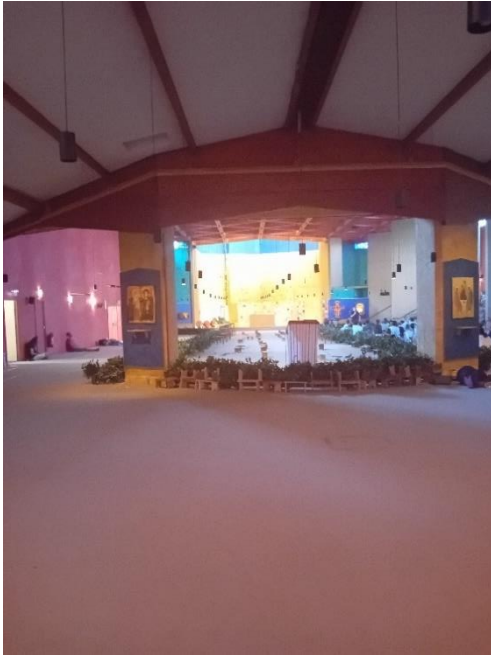
Kuva 4: Sovituksen kirkko, jossa rukoushetket järjestetään.