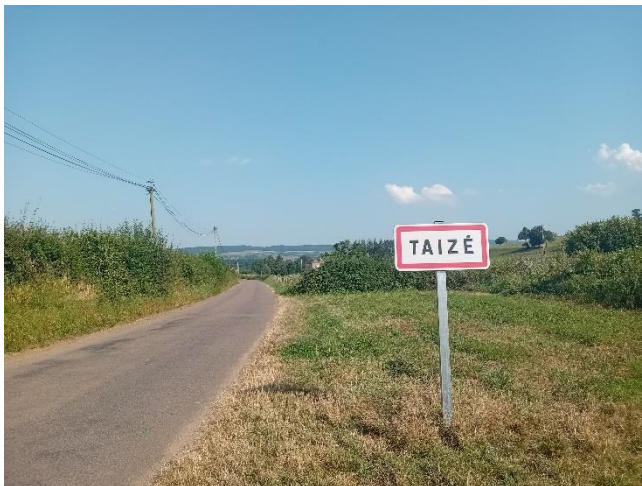
Kuva 3: Taizéhen johtava kylätie Ranskassa.

Matkustimme luostariyhteisöön maata pitkin laivalla ja bussilla. Viivymme luostarissa yhteensä kuusi päivää sunnuntaista sunnuntaihin. Osallistuin viikon ajan luostarin ohjelmaan: rukoushetkiin, raamattuluentoihin, reflektioryhmiin, käytännölliseen työntekoon, ruokailuihin sekä tutustuin luostarin alueella oleviin vapaa-ajanviettomahdollisuuksiin, kuten kävin kävelemässä alueella sijaitsevassa hiljaisuuden puutarhassa (engl. Garden of Solidarity ), tutustumassa naapurikylään ja ostamassa luomutuotteita läheisestä kyläkaupasta. Kuvasta 3 on nähtävillä ympäristöä, jossa luostariyhteisö sijaitsee.