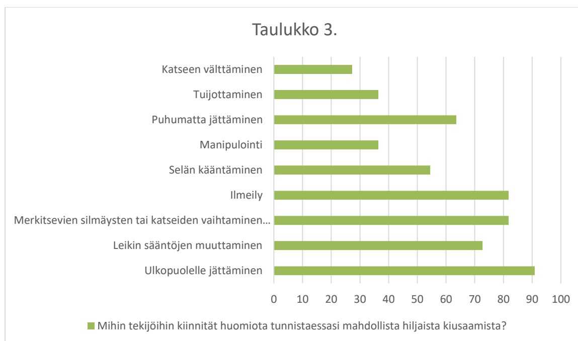
Taulukko 3. Hiljaisen kiusaamisen tunnistamisessa huomioitavat tekijät

Vastaajista 3 (27,3 %) kiinnittää huomiota katseen välttämiseen. Tuijottamiseen kiinnittää huomiota vastaajista 4 (36,4 %). Puhumatta jättämiseen kiinnittää 7 (63,6 %) huomiota. Manipulointi 4 (36,4 %) ja selän kääntäminen 5 (54,5 %). Ilmeilyyn kiinnittää huomiota vastaajista 9 (81,8 %). Merkitsevien silmäysten tai katseiden vaihtamiseen kiinnittää huomiota 9 (81,8 %). Leikin sääntöjen muuttamiseen 8 (72,7 %) ja ulkopuolelle jättämiseen