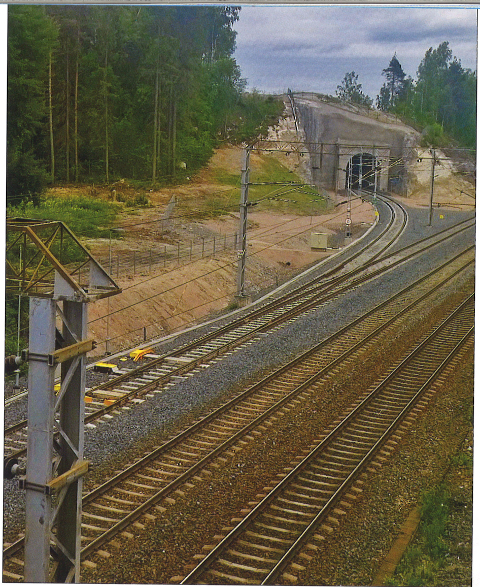
Infrastruktuurin rahoituksen ja hallinnan murros jatkuu vaikuttaen infrastruktuurin kehittämisedellytyksiin ja haavoittuvuuksiin ja siten toimitusketjujen toimintaedellytyksiin.

Asiantuntijat eivät usko sähkö- ja tietoliikenneriippuvuuden vähenevän 2030-luvulle tultaessa. Yhteiskunnan kasvanut tietointensiivisyys ja lisääntynyt riippuvuus sähköstä asettavat uudenlaisia vaatimuksia toimitusketjuille. Vaikka toimitusketjut ovat haavoittuvaisia sähkö- ja tietoverkkojen häiriöille, kehittyvä keinovalikoima, kuten uusiutuvat energianlähteet ja saarekkeinen energiantuotanto, vähentää riippuvuuden negatiivisia vaikutuksia.