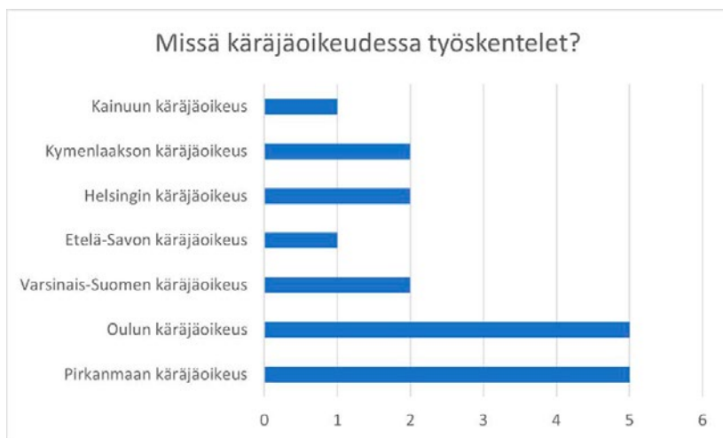
Kuvio 1. Kyselyyn vastanneet käräjäoikeuksittain. N=18.

Kyselyvastausten perusteella sakon muuntorangaistusasioiden vastaajat osallistuvat hyvin harvoin heitä koskevan sakon muuntoasian käsittelyyn. Kyselyyn vastanneista vähän yli puolet (56 %) vastasi, että sakon muuntoasian vastaaja ei juuri koskaan osallistu istuntoon ja kaikki loput vastasivat vastaajan osallistuvan istuntoon joko ”harvoin” tai ”joskus”. Lähes kaikki kyselyyn vastanneista käsittelijöistä (94 %) olivat sitä mieltä, että vastaajan läsnäolo istunnossa ei ole edes tarpeen.