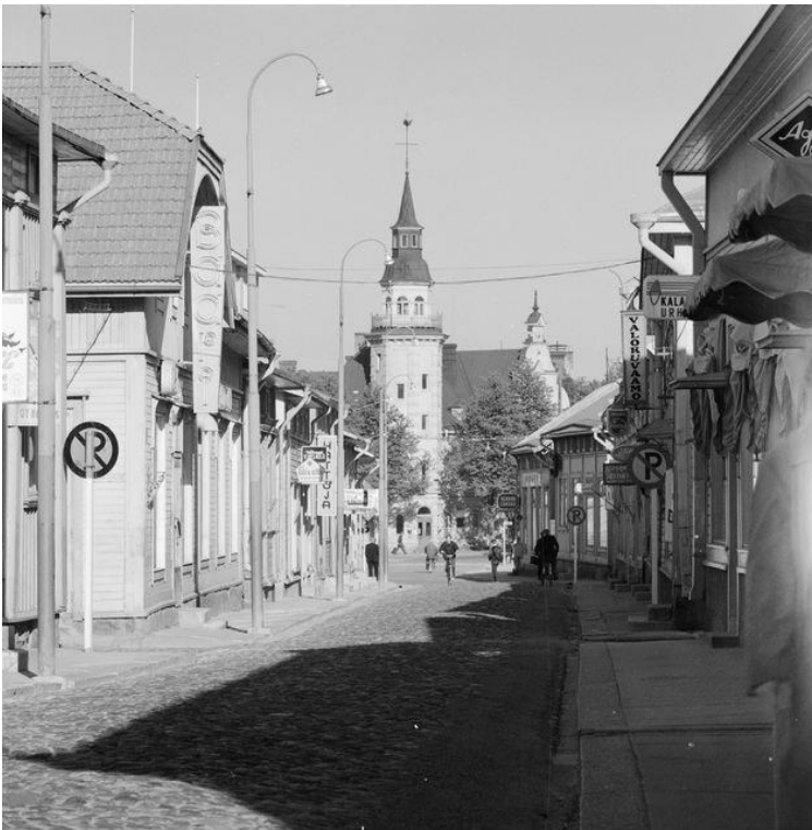
Kuva 2: Vanhan Rauman Kuninkaankatu vuosien 1957–1961 aikana.

erilaisilla laatoilla erotettu molemmin puolin tietä kapea kävelykatu. Joillakin kaduilla oli puisia sähkötolppia. Lisäksi alueella oli monessa kotitaloudessa tuotantoeläimiä, kuten lehmiä, hevosia ja kanoja, joille oli pihapiireissä aitauksia ja talleja. 96 Maisema oli tuolloin alueella hyvin yksinkertainen ja koruton. Kuvasta kaksi kuitenkin näkee selvästi, että alueen maisema on muuttunut kaupallisemmaksi. Kyseisestä kuvasta huomaa monia elementtejä, joita ei vielä 1940–1950-luvun alussa ollut maisemassa ollenkaan. Esimerkiksi katujen puiset sähkötolpat on vaihtunut metallisiin katuvaloihin, joissa osassa on korkealle asetettuja mainoskylttejä. Tuolloin pääkatujen varsilla oli pieniä liikkeitä, joiden näyteikkunat eivät olleet vielä näyttävän suuria. Liikkeillä oli julkisivuissaan osittain pieniä, mutta massiivisia nimikylttejä. Alueella oli myös joitakin normaalin kokoisia liikennemerkkejä. Lisäksi Vanhaan Raumaan oli sijoitettu rakennusten julkisivuihin isoja kelloja, joita nykyisessä katukuvassa ei ole. Kadut olivat edelleen 1960-luvulle tultaessa mukulakivipintaisia, joista kävelykadut oli niin ikään erotettu laatoilla. 97