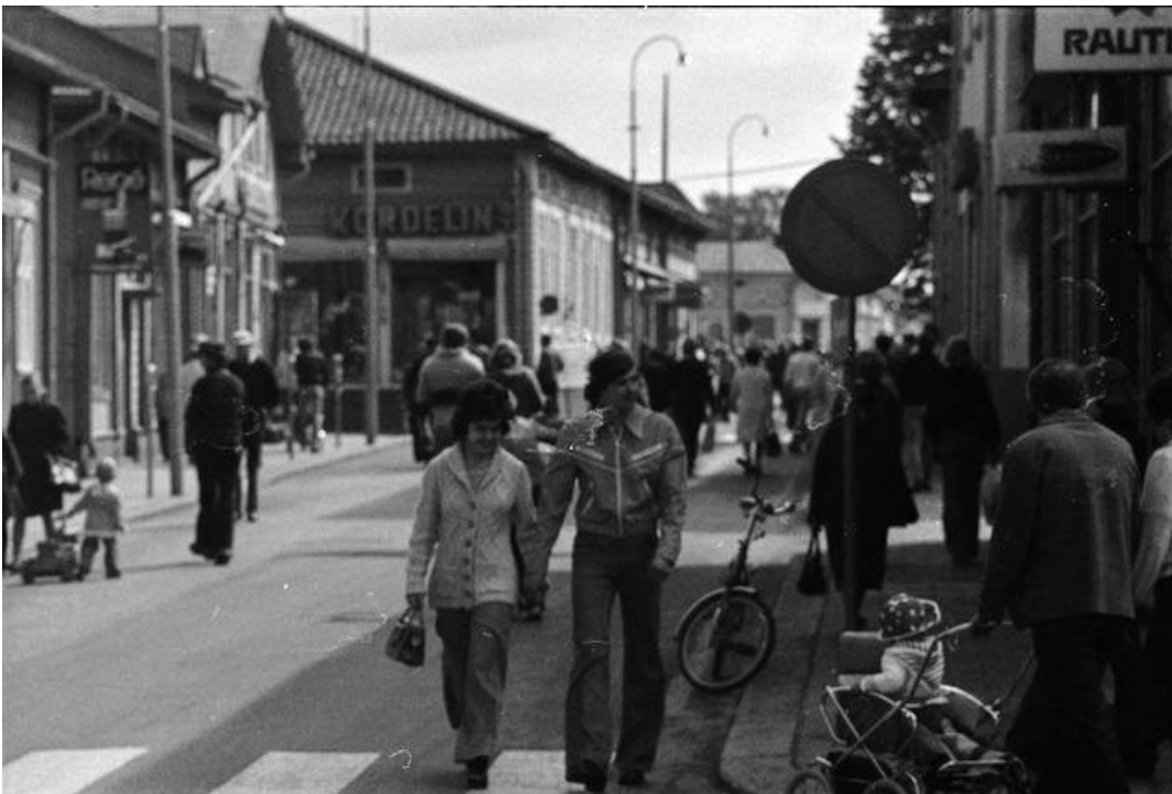
Kuva 3: Vanhan Rauman katukuvaa 13.6.1976.

Sitoutumisvaiheen alkupuolella alueella vallitsi kuitenkin vaatimaton elintaso, josta kertoo hyvin se, että vielä 1970-luvulla monessa talossa pidettiin kanoja. 127 Erään haastattelun mukaan 1970-luvun lopusta 1980-luvulle asti Rauman kaupunki hiljeni kesäkuukausien ajaksi asukkaiden lähdettyä kesämökeilleen. 128 Kuten kuvasta näkee, sitoutumisvaiheen loppupuolella Vanhalle Raumalle alkaa kuitenkin muodostua tyypilliseksi näkymäksi vilkkaat pääkadut. Sitoutumisvaiheen turismikuvissa alkaa näkyä perinteisiä turismikäytäntöjä, kuten turistiryhmiä opaskierroksella, kesäteatteria ja museorakennuksia. 129