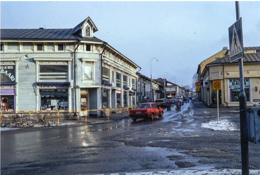
Kuva 4: Vanhan Rauman torin kulmilla 27.1.1990.

Kehitysvaiheen aikana Vanhan Rauman maiseman muutos on ollut suuri. Kuva neljä kertoo hyvin, kuinka vielä vuonna 1990 Vanhan Rauman maisema oli samantyylinen kuin sitoutumisvaiheessa. Tuolloin Vanhan Rauman kadut olivat asfalttipäällysteisiä, ja kävelykadut oli merkitty selväksi erilaisella kivetyksellä. Alueella oli edelleen 1970-luvulta lähtien paikoitellen katunäkymää hallitsevia metallisia punakeltaisia kaiteita autotien ja kävelykadun välissä. Lisäksi katukuvaa hallitsivat suuret liikennemerkkit ja katupylyvät. Liikkeiden valomainokset olivat maisemassa hallitsevassa asemassa varsinkin pääkatujen varsilla. Vanhan Rauman alueella oli hyvin nykyaikaisia elementtejä, jotka eivät olleet samantyyliisiä alueen rakennuskannan ja muun ympäristön kanssa. Vuodesta 1991 lähtien Vanhan Rauman ilmettä pyrittiin muuttamaan entistä yhtenäisemmäksi. 194