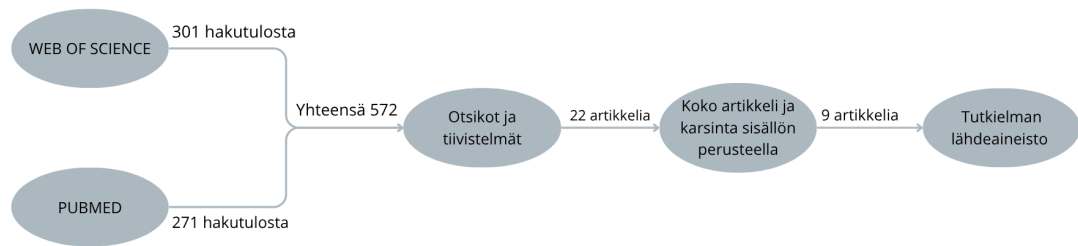
Kuva 1: Hakuprosessi ja valintaperusteet

ja tiivistelmät, joiden perusteella karsittiin pois artikkelit, jotka eivät vastanneet tutkimuskysymyksiin. Tämän tarkasteluprosessin jälkeen tarkempaan tarkasteluun valittiin 22 artikkelia, joista lopulliseen tutkielmaan sisällytettiin 9. Artikkelien valinnassa suosittiin ajankohtaisuutta. Lähteeksi ei valittu ennen vuotta 2019 julkaistuja tutkimuksia. Kaikki valitut tutkimukset olivat vähintään JUFO-luokituksen 1 omaavilta julkaisijoilta. Lisäksi taustaluvun kokoamista varten suoritettiin hakuja Google Scholar -tietokannassa avainsanoilla " Type 1 diabetes ", hypoglycemia , hyperglycemia , insulin , ketoacidosis , " insulin pump " ja " glucose monitoring ". Hakuprosessi on esitetty kuvassa 1.