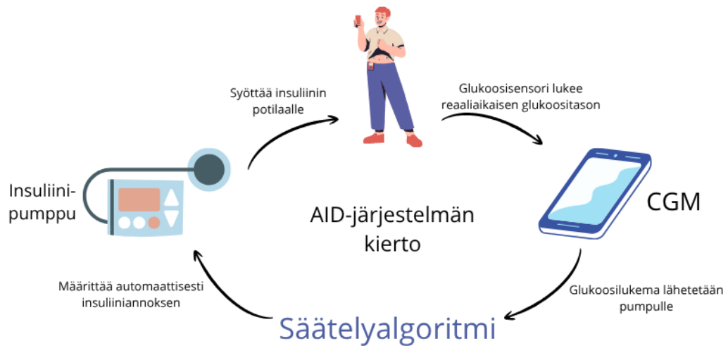
Kuva 3: AID-järjestelmä luo suljetun kierron kolmen pääkomponentin välille.