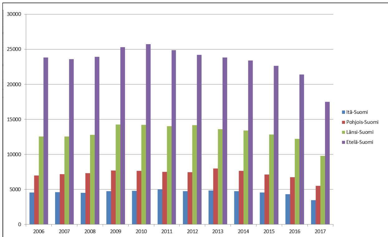
KUVIO 2. Vuosina 2006–2017 annettujen ensimmäisten nimien lukumäärät.

alueilla pudotus on yli 20 %, mutta ei niin paljon kuin Etelä-Suomessa. Toiseksi eniten nimien määrä on tutkimusaikana vähentynyt (23,7 %) Itä-Suomen alueella, missä nimiä annettiin koko tutkimusaikana vähiten, 4547 kpl vuonna 2006 ja 3468 kpl vuonna 2017. Länsi- ja hiukan yllättäen Pohjois-Suomessa annettujen nimien määrä on laskenut vähiten, hiukan reilut 21 %. Länsi-Suomessa on lukumääräisesti annettu tutkimusaikana toiseksi eniten nimiä eli 12 544 kpl vuonna 2006 ja 9807 kpl vuonna 2017. Vastaavat luvut Pohjois-Suomen osalta ovat 7001 kpl ja 5522 kpl.