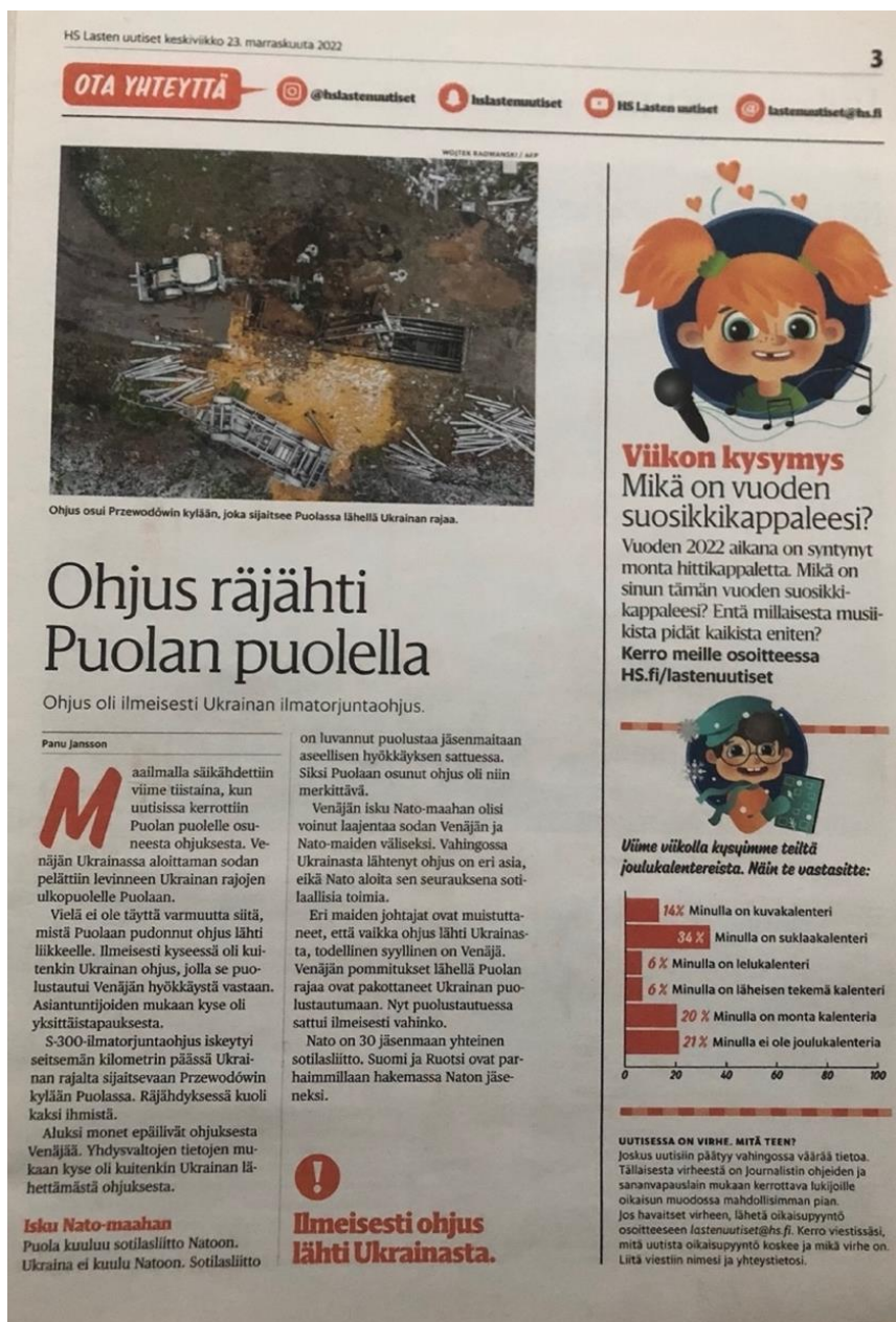
Kuva 3. "Ohjus räjähti Puolan puolella" -uutinen (LU 23.11.2022).