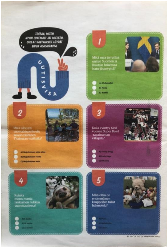
Kuva 1. Lasten uutiset -lehden etu- ja takakansi (LU 8.2.2023).