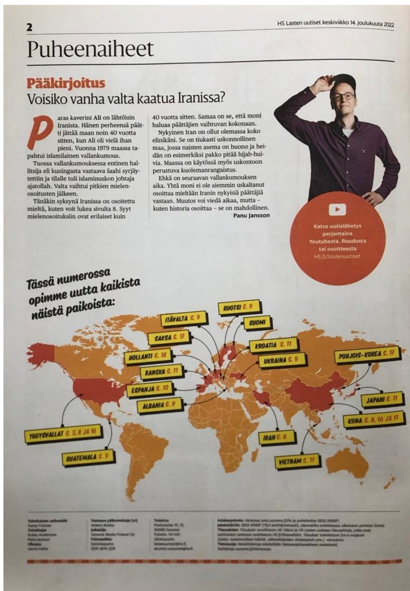
Kuva 7. Voisiko vanha valta kaatua Iranissa? -pääkirjoitus (LU 14.12.2022).

”Voisiko vanha valta kaatua Iranissa?” -pääkirjoituksessa (LU 14.12.2022) toimittaja kertoo parhaasta ystävästään, joka on kotoisin Iranista. Henkilökohtainen tarina yhdistetään lehden juttuun Iranin mielenosoituksista. Henkilökohtaisuus tuodaan tekstissä esiin esimerkiksi yksikön 1. persoonan possessiivisuffiksilla sanassa kaverini :