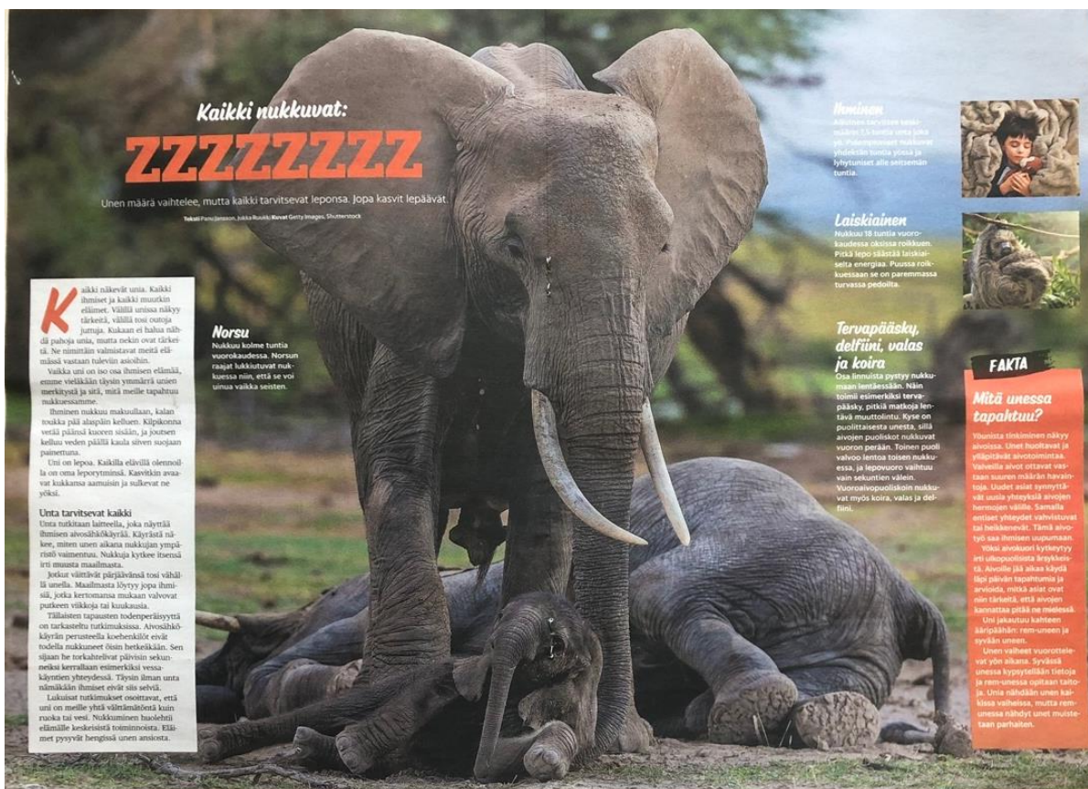
Kuva 9. Kaikki nukkuvat: ZZZZZZZZ -juttu (LU 8.2.2023).

Jutussa esitellään ihmisen unen piirteiden lisäksi eri eläinten unen tarvetta ja nukkumistapoja. Tämä tuo juttuun viihdyttävyyttä ja korostaa jutun opetuksellista sanomaa: kaikki tarvitsevat unta, niin ihmiset kuin myös eläimet. Aiemmissä tutkimuksissa on todettu, että eläinaiheet kiinnostavat lapsia (Alon-Tirosh–Lemish 2014). Eläinten käsittely uneen liittyvässä jutussa tuo aiheeseen konkretiaa ja kiinnostavuutta lapsille. Jos juttu olisi suunnattu aikuisille, lähestymistapa aiheeseen saattaisi olla tieteellisempi.