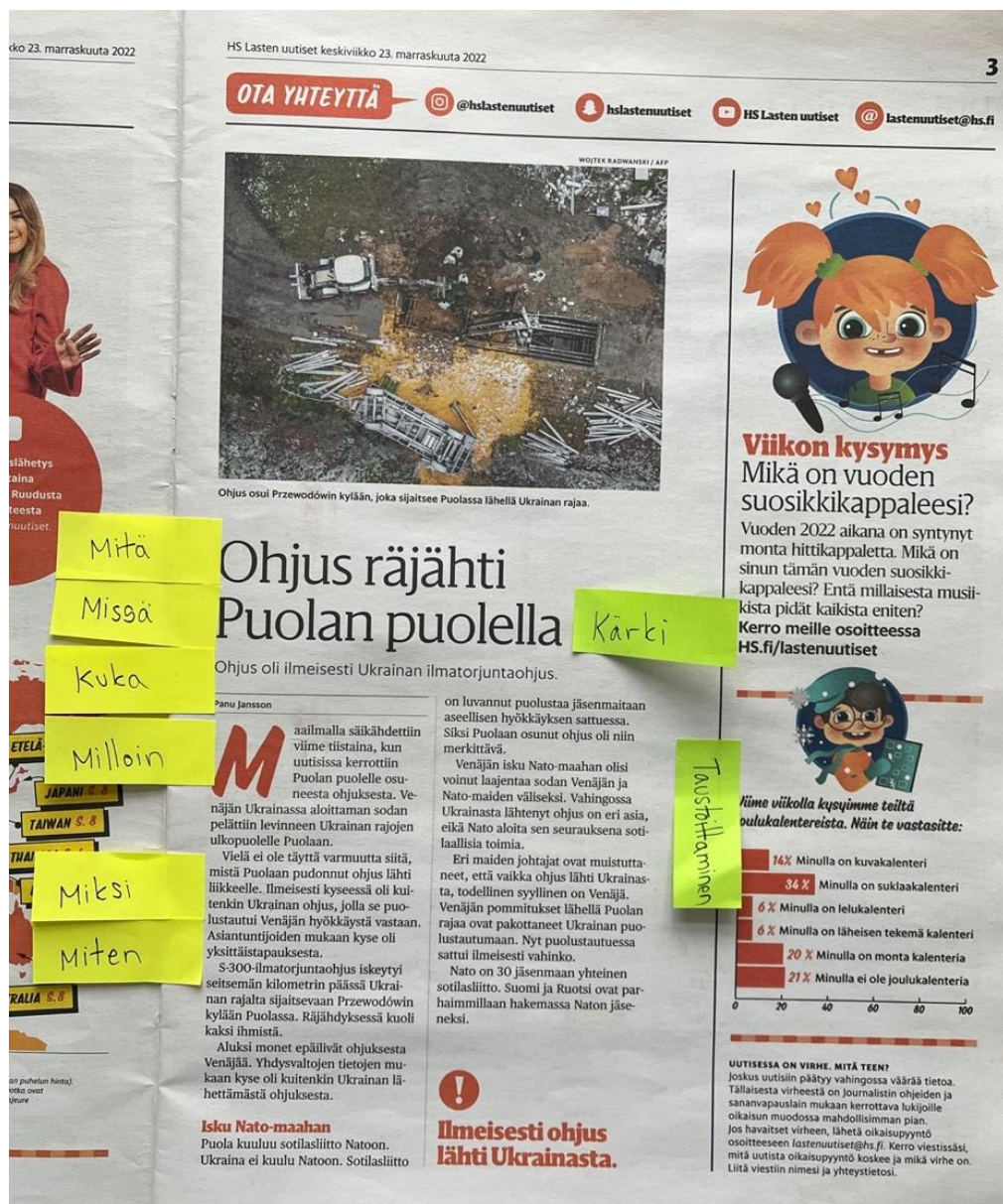
Kuva 4. "Ohjus räjähti Puolan puolella" -uutisen rakenne ja uutiskysymykset (LU 23.11.2022).

Uutisen rakennetta voidaan tarkastella myös uutisskeeman käsitteen avulla. Van Dijk (1988: 178) mukaan uutisskeeman jaksoja ovat tiivistelmä, päätapahtumat ja niiden seuraukset, taustatiedot ja kommentit. Analysoimassani uutisessa tiivistelmän muodostavat otsikko ja ingressi. Uutisen päätapahtumat kerrotaan uutisen neljässä ensimmäisessä kappaleessa: