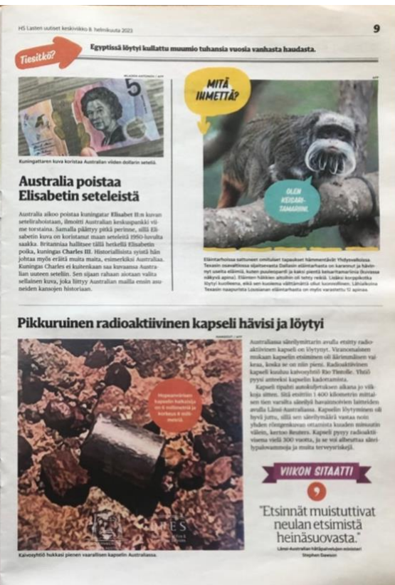
Kuva 2. Esimerkki Lasten uutiset -sanomalehden aukeamasta (LU 8.2.2023).